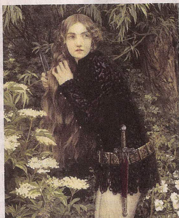
Προ-ραφανλική ατμόσφαιρα. Της Eleanor Fortescue-Brickdale, 1871-1945.